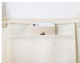
内ポケット付き で便利