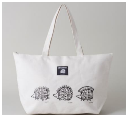
特大サイズで 厚めなキャンバス地！