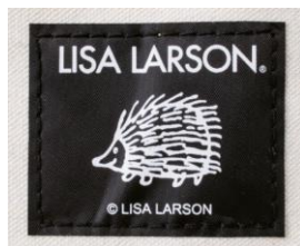
かわいい ハリネズミのタグ付き